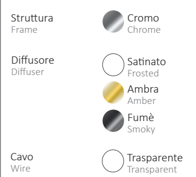
TAVOLA FINITURE : Table of Finishes :